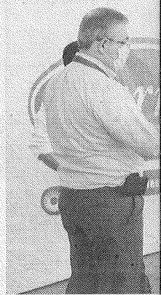
Se darán a la tarea

En este tema Ca acudió a la empres presencia internacio la colonia El Lech